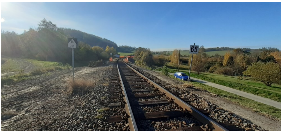
Obrázek 1 aktuální stav dřevin v místě realizace záměru

Podle ustanovení § 12 odst. 2 zákona o ochraně přírody a krajiny, je k umístování a povolování staveb, jakož i jiným činnostem, které by mohly snížit nebo změnit krajinný ráz, nezbytný souhlas orgánu ochrany přírody. Krajinným rázem je zejména přírodní, kulturní a historická charakteristika určitého místa či oblasti, je chráněn před činností snižující jeho estetickou a přírodní hodnotu. Zásahy do krajinného rázu, zejména umístování a povolování staveb, mohou být prováděny pouze s ohledem na zachování významných krajinných prvků, zvláště chráněných území, kulturních dominant krajiny, harmonického měřítka a vztahů v krajině. Předmětem záměru je rekonstrukce mostu v místě stávající železniční trati, jedná se o opravu bez významné změny stávajícího stavu. Záměr se nedotýká zvláště chráněných území, památných stromů, územního systému ekologické stability, významných krajinných prvků, evropsky významných lokalit ani ptačích oblastí. Kulturní dominanty krajiny, harmonické měřítka a vztahy v krajině zůstanou po realizaci záměru zachovány. Přírodní a estetická hodnota území tedy nebude snížena. Po posouzení záměru došel městský úřad k názoru, že záměrem nedojde ke snížení nebo změně krajinného rázu. Z výše uvedeného vyplývá, že zájmy chráněné dle § 12 odst. 2 zákona o ochraně přírody a krajiny, nejsou záměrem dotčeny, realizace záměru nevyžaduje vydání souhlasu podle § 12 odst. 2 zákona o ochraně přírody a krajiny. (Frnk)